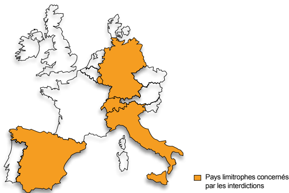
■ Pays limitrophes concernés par les interdictions