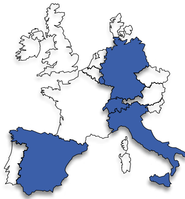
■ Pays limitrophes concernés par les interdictions

En juillet et en août, une restriction de circulation supplémentaire s'applique les samedis, de 7 heures à 20 heures sur certaines autoroutes et, dans une moindre mesure, sur des tronçons de routes fédérales chargés pendant les vacances scolaires d'été. Pour plus d'informations, consultez le site : www.europe-camions.com/news/interdiction-circuler/alle-magne-de